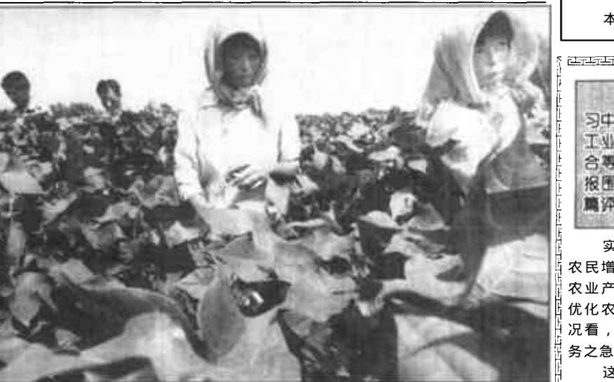
全市棉花生产冠军乡

史口镇在郝纯路两侧统一规划，建设民营园区，集中面粉厂等十多个个体私营大户到园区内经营，各职能部门提供全方位优质服务。目前全镇私营户已发展到2400家，从业人员近1万人，力争全镇私营经济一项人均增收110元。 三是对全镇建筑、安装、电讯、市政等七家支柱产业进行改制，抓好规范完善工作。并在改制的基础上进行资产重组，将原镇办企业氯化聚乙烯