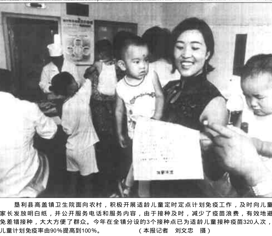
垦利县高盖镇卫生院面向农村，积极开展适龄儿童定时定点计划免疫工作，及时向儿童家长发放明白纸，并公开服务电话和服务内容，由于接种及时，减少了疫苗浪费，有效地避免接种差错，大大方便了群众。今年在全镇分设的3个接种点已为适龄儿童接种疫苗320人次，儿童计划免疫率由90%提高到100%。